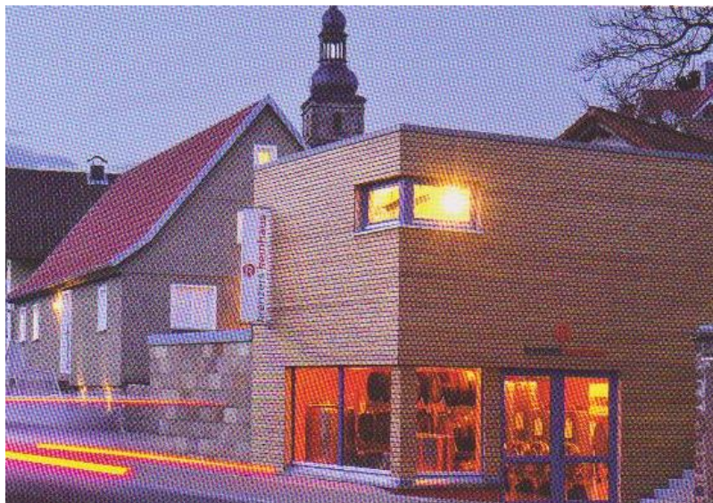
Besuch der Schaukelterei in Ehrenberg-Seiferts