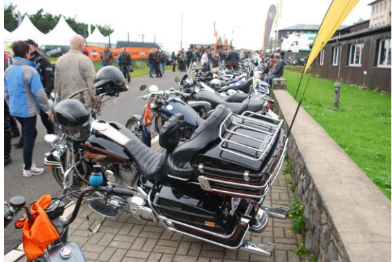
Impressionen aus Fulda und von der Wasserkuppe