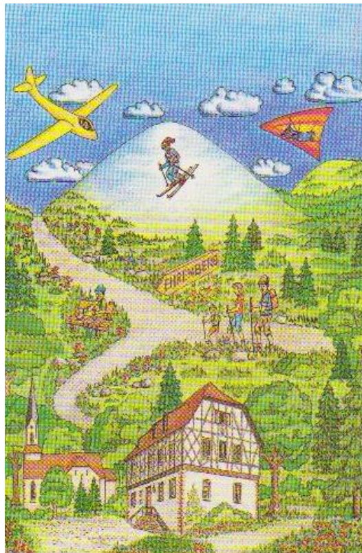
Ehrenberg in einer Wunschlandschaft

Nach diesem Highlight freuten sich alle auf die Führung in der Rhöner Schau-Kelterei der Familie Krenzlers in Ehrenberg Ortsteil Seiferts mit Apfelschaukeltereie und Verköstigung von Apfelwein, Apfelscherry und Cidre sowie anschließendem Kaffee- und Kuchenessen.