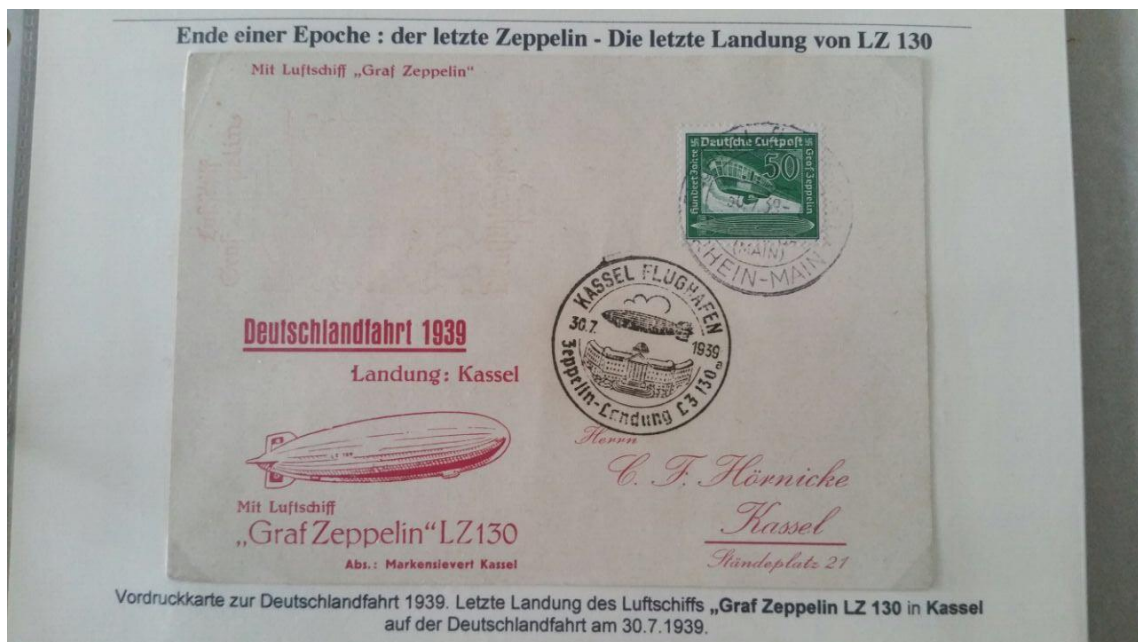
Aus der Ausstellung am Großtauschtag ein Beleg zur letzten Landung des Luftschiffs Graf Zeppelin LZ 130 in Kassel